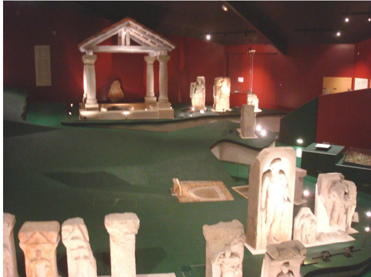
les sources d'Hercule

Zondag 20/5: We verlaten Lunéville en rijden via Nancy naar Metz voor een laatste halte: het zeer moderne gebouw van het "Centre Pompidou". Er zijn 2 tijdelijke tentoonstellingen: muurtekeningen van de Amerikaanse Sol Lewitt en werken van de Bretoense broers Buroullec.