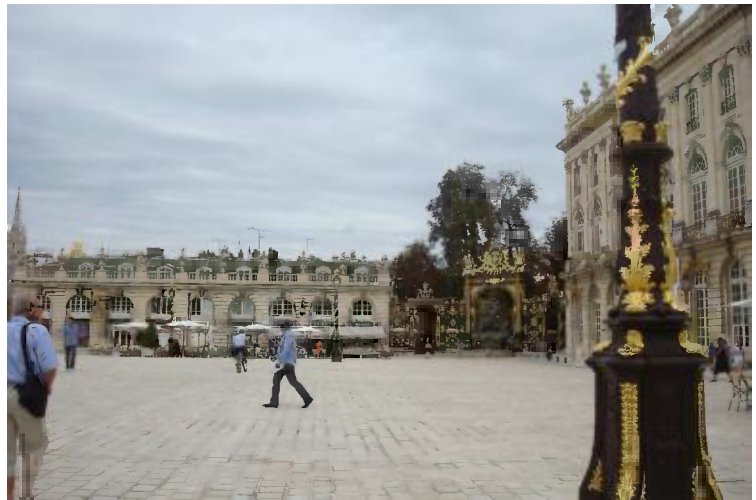
Place Stanislas te Nancy

Zaterdag 19/5: Vandaag beginnen we met een bezoek aan Baccarat, de stad van het kristal. Eerst bekijken we de kerk St Géry. Deze betonnen constructie werd tussen 1953 en 1957 gebouwd op de plaats van de vroegere kerk, vernietigd door een geallieerd bombardement in 1944. Het donkere interieur wordt beheerst door de kleurrijke ramen in Baccaratkristal boven de muren, en de uitbeelding van de apostelen in het koor. Het algemene thema is “Het leven en het licht”; opvallend is de aanwezigheid van driehoeken in de constructie.