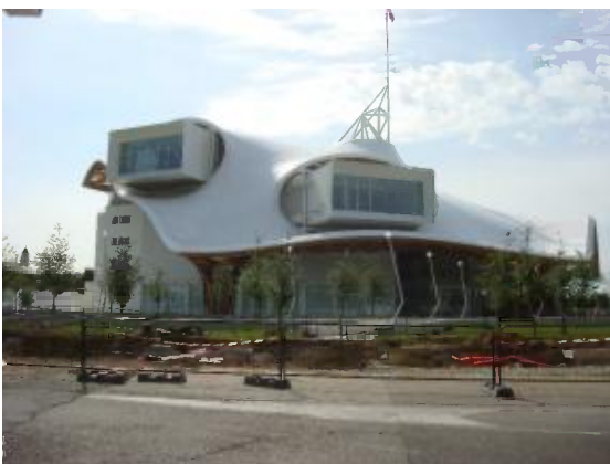
Centre Pompidou te Metz

Zondag 20/5: We verlaten Lunéville en rijden via Nancy naar Metz voor een laatste halte: het zeer moderne gebouw van het "Centre Pompidou". Er zijn 2 tijdelijke tentoonstellingen: muurtekeningen van de Amerikaanse Sol Lewitt en werken van de Bretoense broers Buroullec.