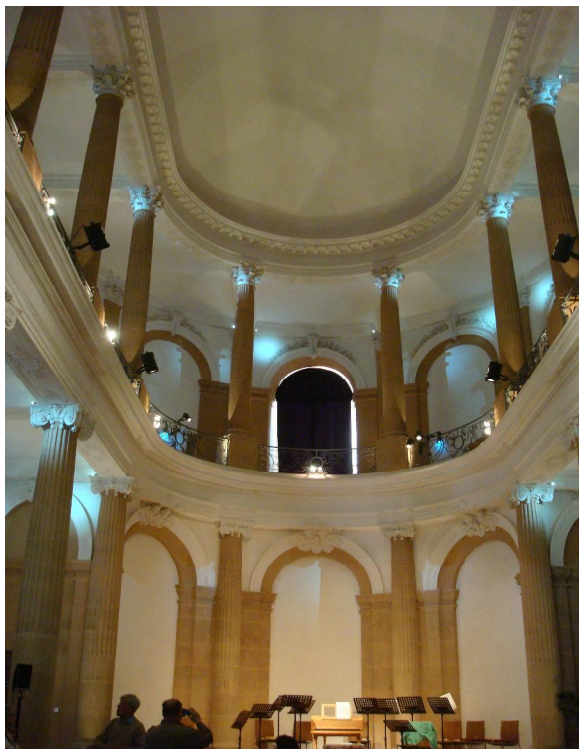
gerestaureerde kapel van het kasteel

Bij het terugkeren naar het hotel zien we nog het zeer merkwaardige “Huis van de koopman” in een typische kleur en met merkwaardige versieringen.