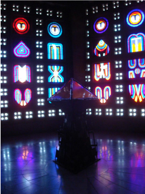
kerk St Géry. te Baccarat

Terug in Lunéville hebben we nog tijd om de tentoonstelling te bezoeken over de vermaarde "Broderies de Lunéville". Er zijn ontwerpen van bekende couturiers zoals Dior, Ungaro en anderen. De dames kunnen hier hun gading vinden.