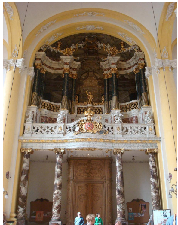
orgel van de Sint-Jacobskerk