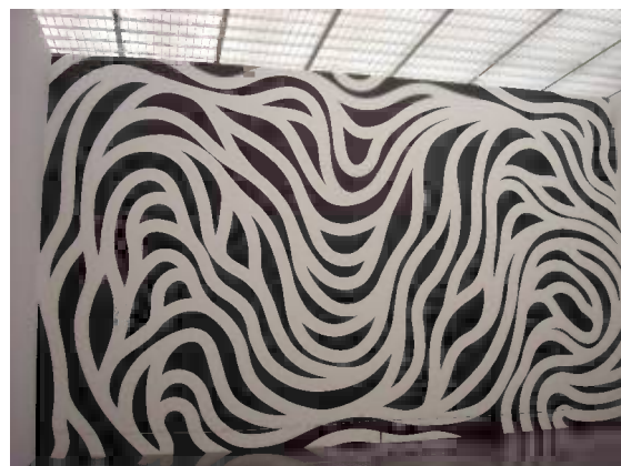
muurschildering Sol Lewitt