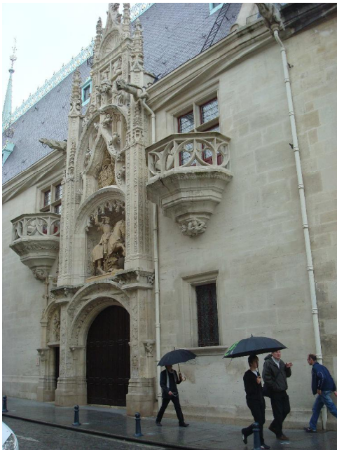
Musée de Lorraine

's Middags eten we een “quiche lorraine “ in het mooie decor van restaurant “Les Césars” op de place Stanislas in Nancy. Nadien verkennen we het stadscentrum met een gids. Op dit prachtig plein bekijken we de gebouwen , de vergulde hekkens en de fontein; dan volgt de “place de la carrière” met enkele merkwaardige gebouwen en een triomfboog ter ere van Lodewijk XV en tenslotte het voormalige hertogelijk paleis, nu een museum. De ingangspoort valt op met het ruitersstandbeeld van hertog Antoine. Binnen zien we enkele middeleeuwse beelden, voorwerpen en schilderijen, etsen van de plaatselijk kunstenaar Jacques Callot en in een kleine donkere ruimte een aantal werken van Georges de la Tour. Naast het paleis bevindt zich de vroegere kerk van de minderbroeders; hier werden de hertogen van Lotharingen begraven; we zien nog het grafmonument van Hertog René II. Tenslotte wandelen we nog even door het Parc de la Pépinière, 23 ha groot en aangelegd als boomkwekerij, nu een groene long voor de stad.